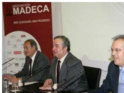
El proyecto está dentro de las actuaciones que lleva a cabo Madeca